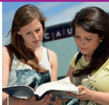
Studieninteressierte vor der Uni

Die Christian-Albrechts-Universität zu Kiel lädt zu den folgenden Veranstaltungen Studieninteressierte ein, die Uni „live“ zu erleben und sich über Studienfächer und Studiengänge zu informieren: