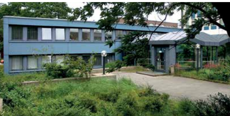
Anbau des Universitätshochhauses, Zentrale Studienberatung

In der persönlichen Sprechstunde können Sie Ihre Fragen stellen und wertvolle Impulse für die Studienorientierung erhalten.