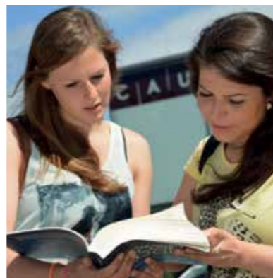
Studieninteressierte vor der Uni

Schülerinnen und Schüler der Oberstufe sind herzlich eingeladen, in Gruppen ganztags an die Uni Kiel zu kommen. Ein Einführungsvortrag, individuell abgestimmte Beratungsbesuche und ein Abschlusstreffen runden den Tag ab. www.uni-kiel.de/schulklassen