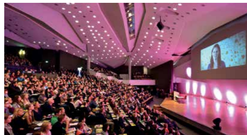
Studierende im bunt illuminierten Frederik-Paulsen-Hörsaal im Audimax

Nähere Infos zum Programm finden Sie unter www.uni-kiel.de/studien-info-tage