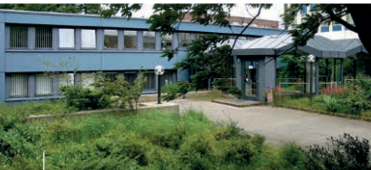
Anbau des Universitätshochhauses, Zentrale Studienberatung

Wir unterstützen Studieninteressierte in allen Phasen der Studienorientierung individuell in Einzelgesprächen oder in der lockeren Runde einer Gruppenberatung. Alle Beratungsangebote sind kostenlos, Informationen finden Sie unter: www.zsb.uni-kiel.de