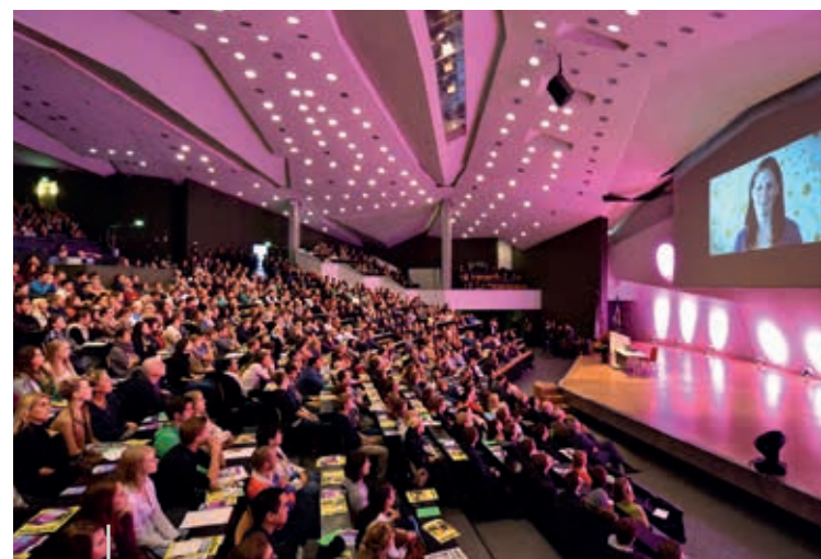
Studierende im bunt illuminierten Frederik-Paulsen-Hörsaal im Audimax

Studienberaterinnen und -berater, Professorinnen und Professoren, wissenschaftliche Angestellte und auch Studierende freuen sich auf ein Gespräch mit Ihnen. Nähere Infos zum Programm finden Sie unter: www.uni-kiel.de/studien-info-tage